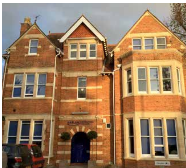
Kaplan International Oxford

Ve škole se nachází 11 tříd, v každé z nich může pohodlně studovat až 15 studentů. Každá třída je vybavena interaktivními tabulemi.