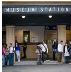
Vlaková stanice Museum