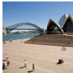
Opera v Sydney