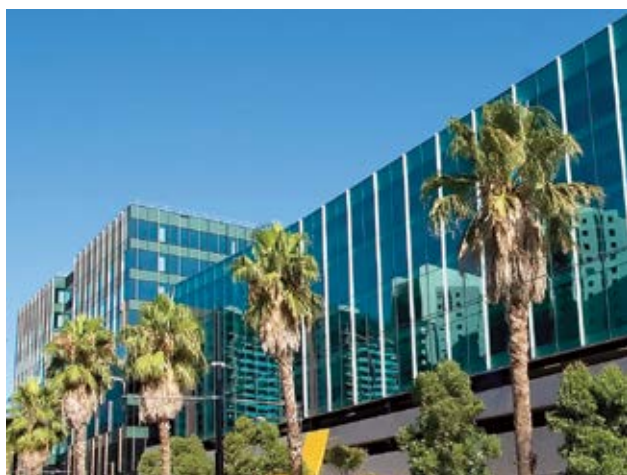
Kaplan International Melbourne