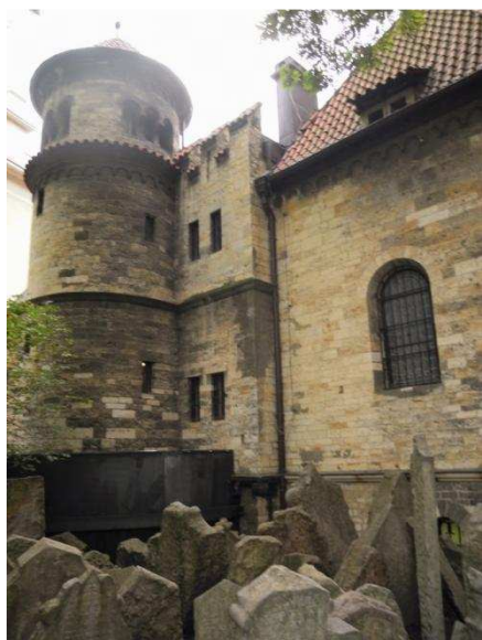
Židovský hřbitov je překvapivě v centru Prahy. Má zvláštní kouzlo, obzvláště prý na podzim