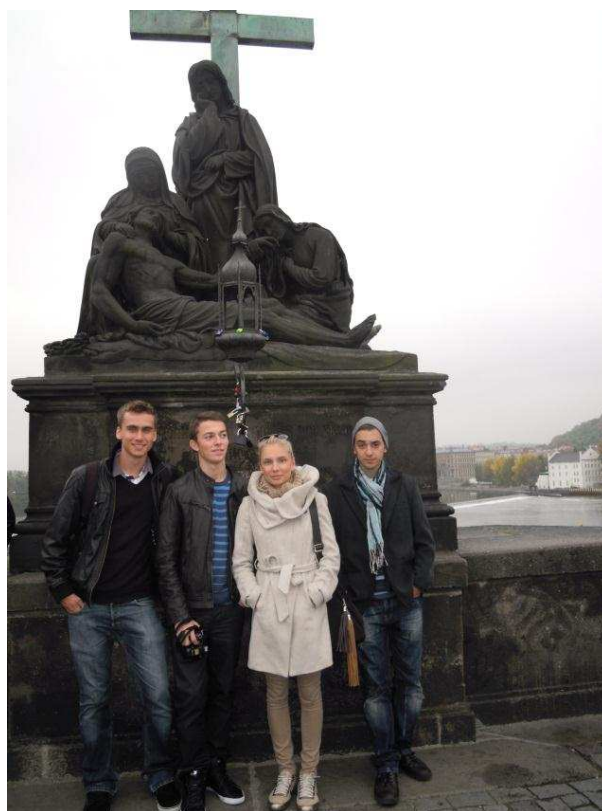
Poslední den – na Karlově mostě