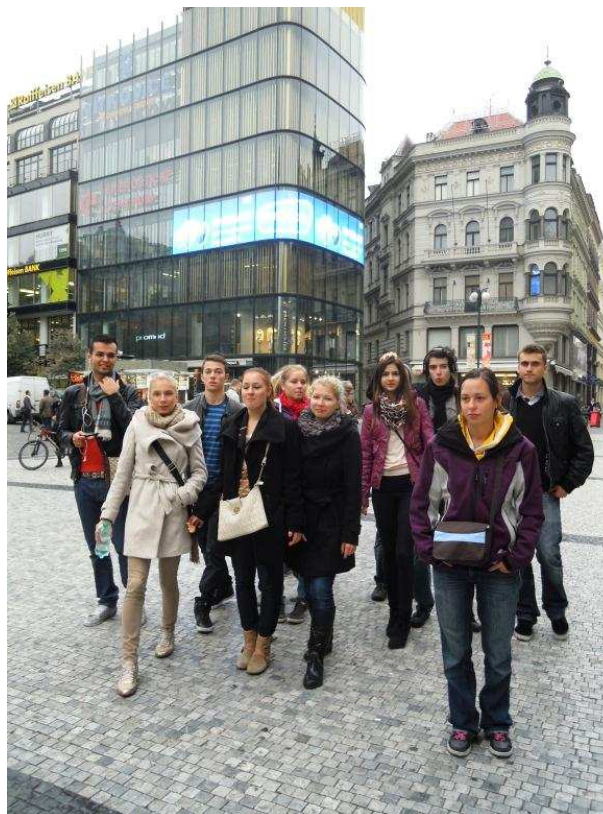
Jdeme na prohlídku Stavovského divadla