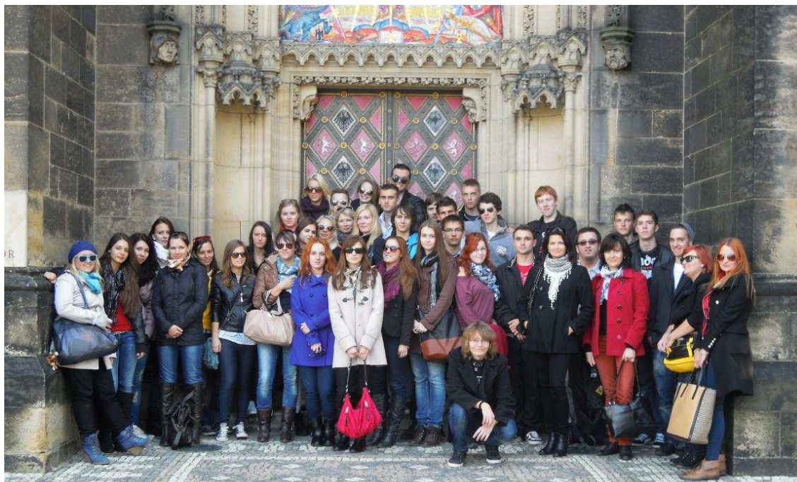
První den – návštěva Vyšehradu