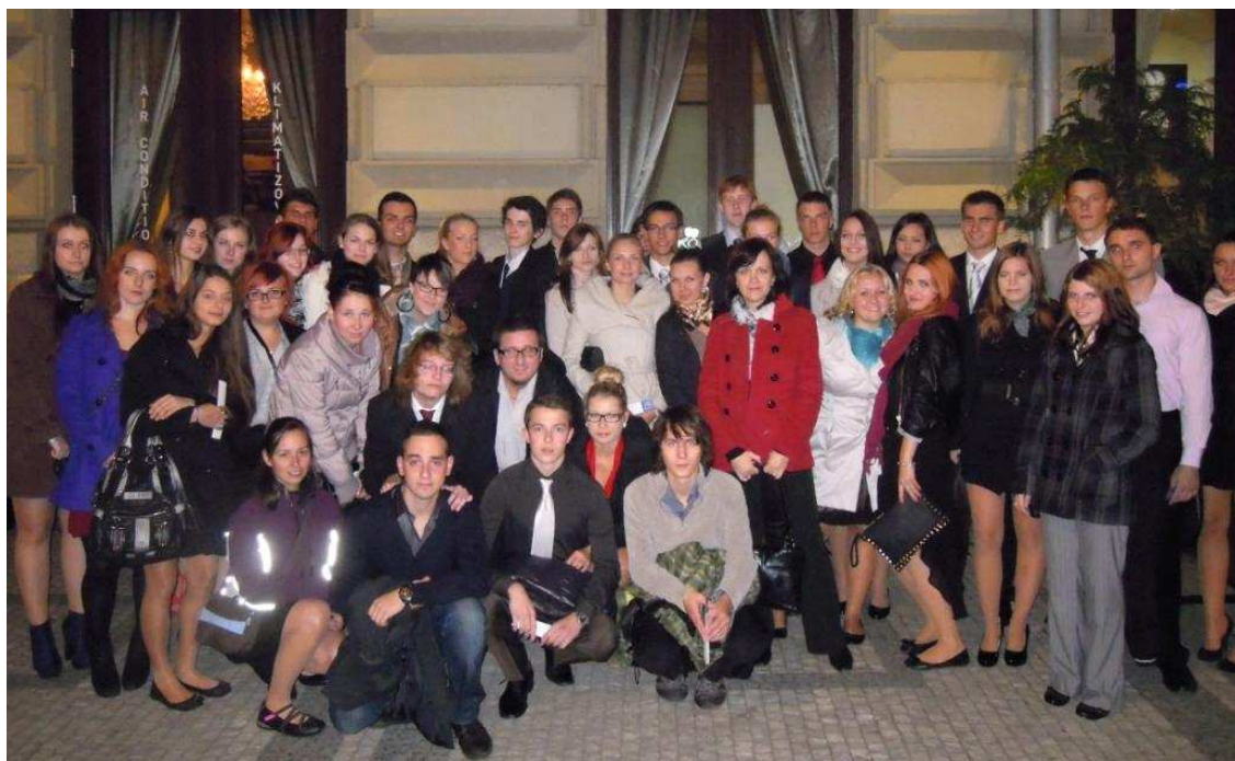
Hudební divadlo Karlín: Jesus Christ Superstar