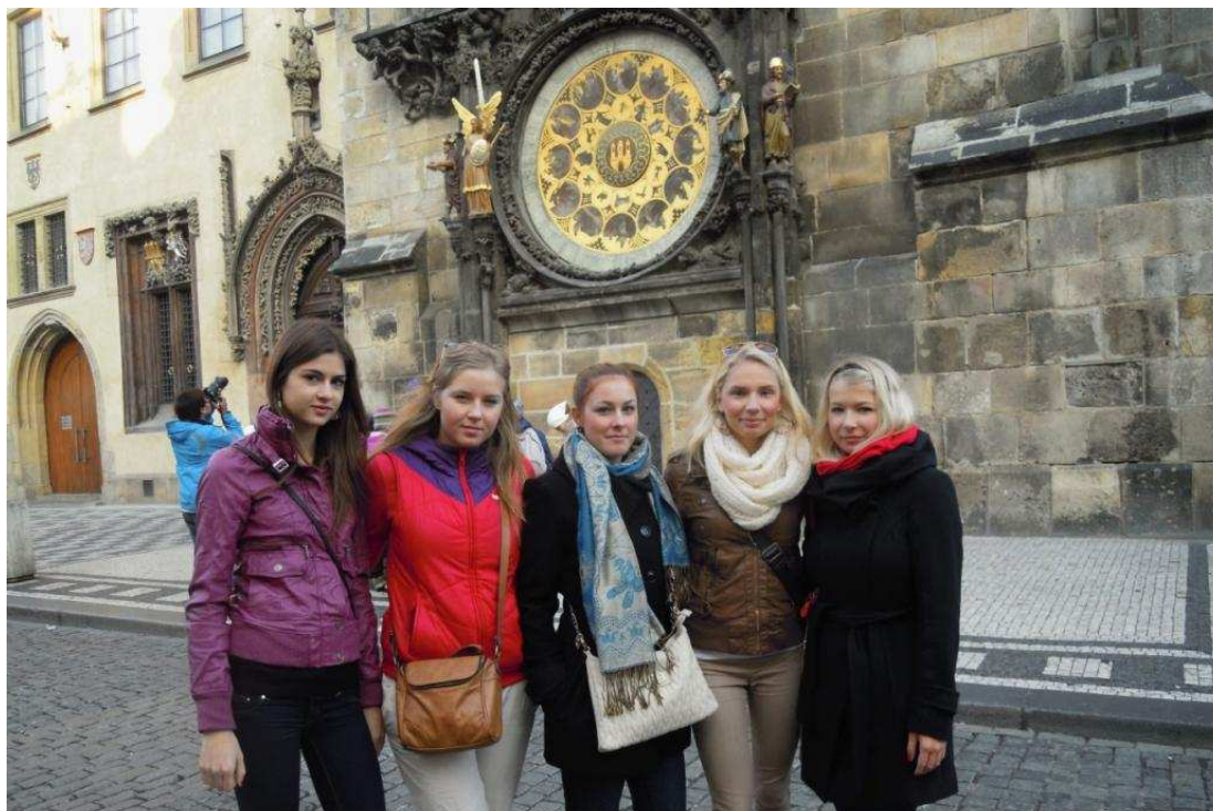
Druhý den – prohlídka centra Prahy, Staroměstské náměstí